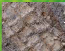
응회암에 남겨진 나무껍질의 모양

또한 나무가 완전히 불타 버리지 않고 탄화목이 된 것(아래 사진)도 많이 발견되고 있습니다.