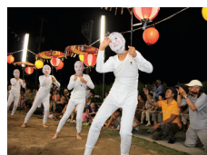
キツネ踊り (国連採無形民俗文化財「姫島の盆踊」):姫島村