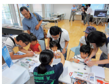
ジオパーク等に関する体験コーナーを用意しています。