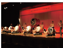
豊勇会太鼓:豊後大野市