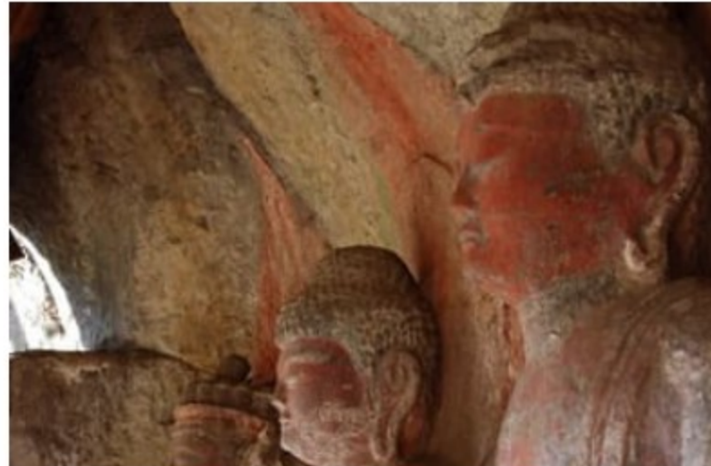
すがおまがいぶつ 菅尾磨崖仏

*時間は駐車場（または駐車スペース）間の一般的な所要時間です。見学時間等は含まれていません。