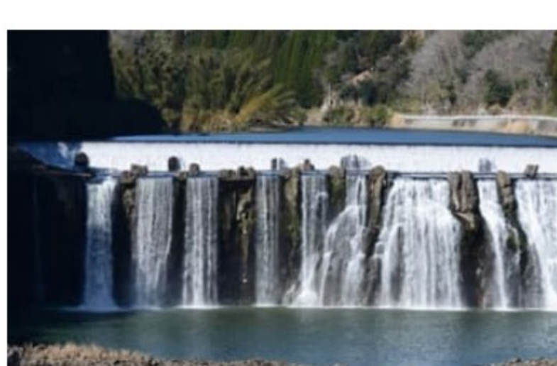
たいざこきょう 滞迫峡

大野川の本流にかかる雄滝は幅約100m、高さは約20mあります。室町時代に雪舟がここを訪れ、「鎮田渾園」を描いたことでも有名です。