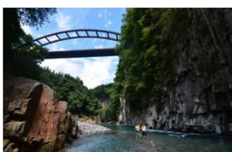
たいざこきょう 滞迫峡

両側を柱状節理の発達した溶結凝灰岩の絶壁で囲まれた、奥岳川沿いの峡谷です。崖の高さは70mにおよびます。