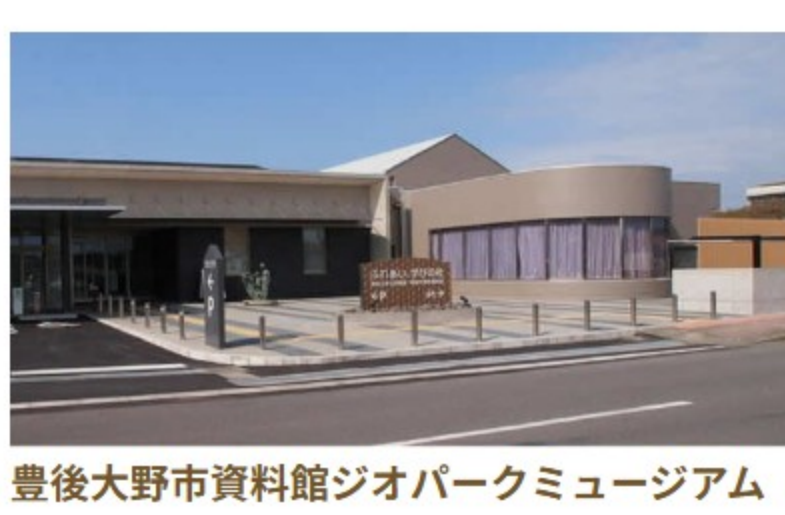
ちんだたき 沈望の滝

平安時代後期に作られた5体の磨崖仏で、約9万年前の阿蘇火砕流の溶結凝灰岩に彫られています。京都や奈良の木造の仏像と比べても遜色なく、国の重要文化財に指定されています。