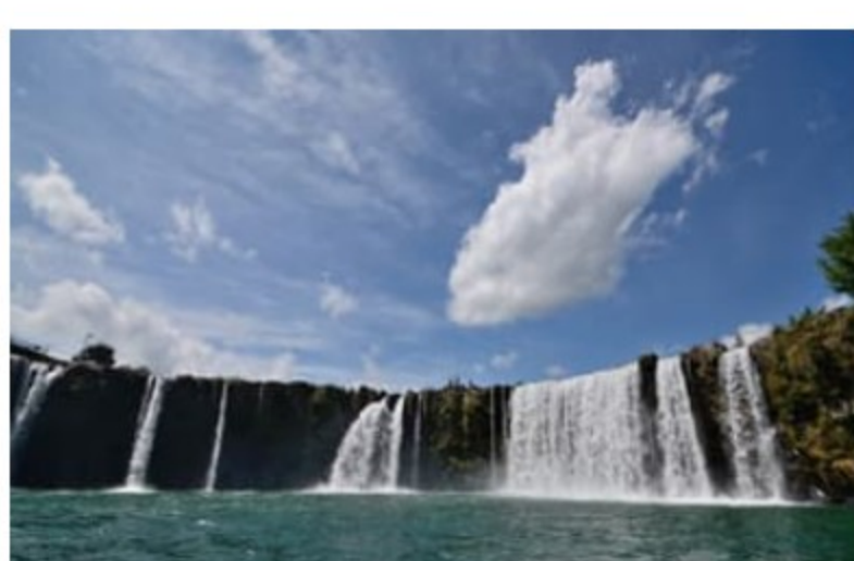
はらしりたき 原尻の滝

轟橋は昭和9年に架けられた2連のアーチ式石橋で、広いほうの径間（アーチの幅）が32.1mと日本一を誇ります。出会橋は大正13年に架けられ、径間が29.3mと日本第二位です。