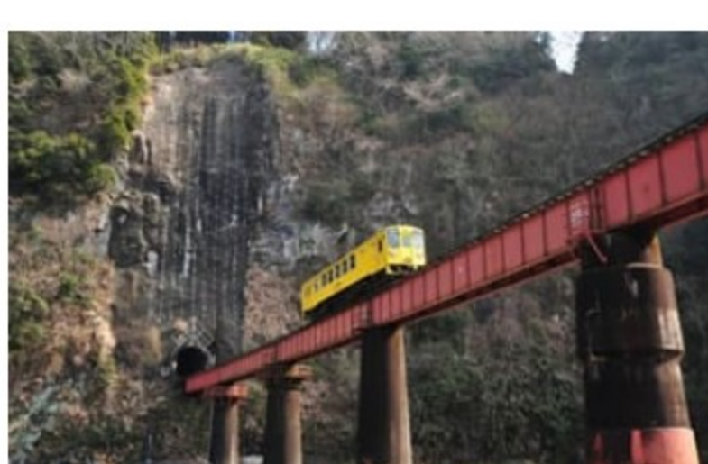
いわどけいかん 岩戸の景観

谷を渡る虹のような橋という意味で、江戸時代の後期、文政七年（1824年）に完成しました。堅牢かつ美しい石橋で、国の重要文化財に指定されています。