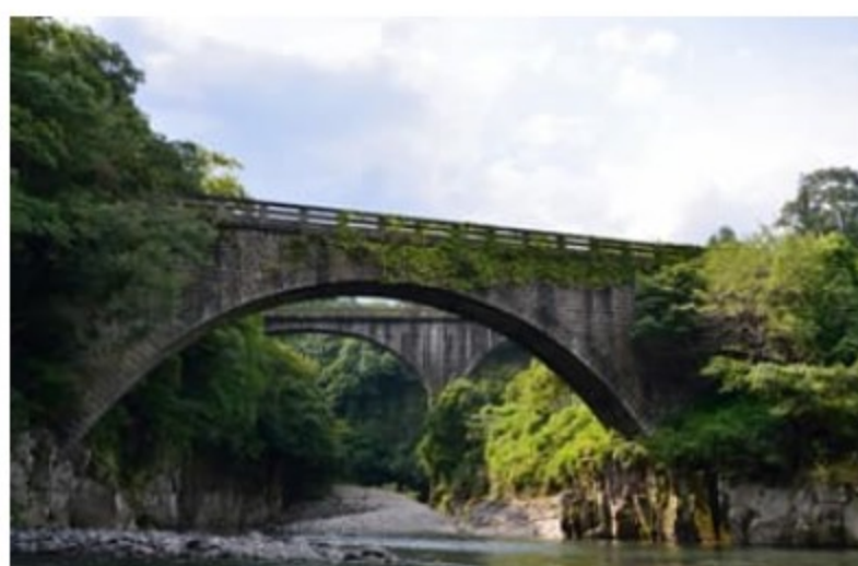
であいげしとどうげし 出会橋・轟橋

大野川と奥岳川の合流点にそびえる絶壁です。崖の下半分は阿蘇火山の3回目の巨大噴火、上半分が4回目の巨大噴火による火砕流でできています。