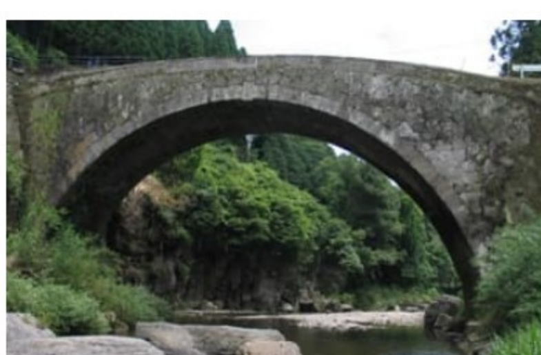
こうかんきょう 虹潤橋

「道の駅みえ」から眺められる風景は「江内戸の景」と呼ばれ、豊かな穀倉地帯をゆったりと流れる大野川を望むことができます。