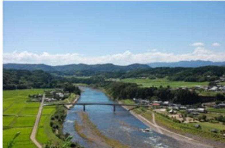
えないどけい 江内戸の景

おおいた豊後大野ジオパークの代表的な見どころを1日かけて回るよくばりなコースです。 滝、石橋、磨崖仏と、おおいた豊後大野ジオパークのエッセンスを満喫できます。