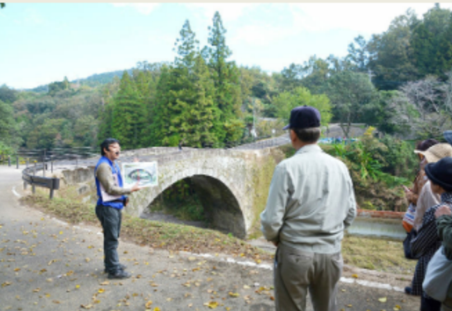
（写真は新規認定審査時および再認定審査時の現地審査風景）

ジオパークに登録されるためには、日本ジオパーク委員会の審査を受けて、ジオパークに認定されることが必要です。また4年に一度、再認定審査を受ける必要があります。おおいた豊後大野ジオパークは、2013年9月に日本ジオパークに新規認定されました。また、その4年後の2017年12月には、審査の結果、無事再認定を受けることができました。