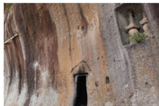
つじわらしふろ 辻河原石風呂

商人によって架けられた美しい橋 谷を渡る虹のような橋という意味で、江戸時代の後期、文政七年（1824年）に完成しました。堅牢かつ美しい石橋で、国の重要文化財に指定されています。