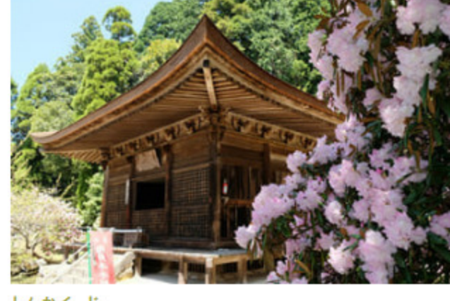
しんかくじ 神角寺

岩壁を利用した癒しと信仰の融合 石風呂とは岩穴の中に蒸気を充満させて入浴する蒸し風呂の一種です。崖には阿彌陀如来を表す梵字が彫られており、仏教に関わる施設であったことがうかがえます。