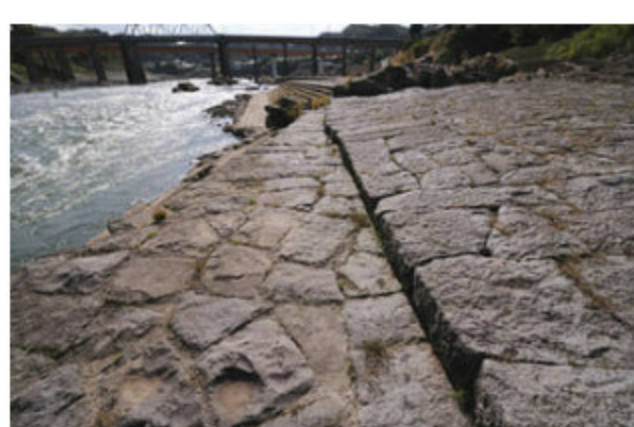
いぬかいるなあと 犬飼港跡

阿蘇火山の巨大噴火による火砕流がもたらした地形や地質をうまく利用し、さまざまな困難を克服しようとした人々の営みを実感できるコースです。