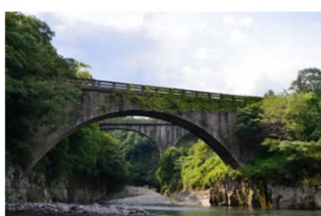
であいばし とどろばし 出会橋・轟橋

殿様も利用した豊後大野の玄関口 江戸時代の初めごろに造られた川港です。河床には切り立った硬い地層が露出していたため、溶結凝灰岩の切り石を平らに敷き詰めています。