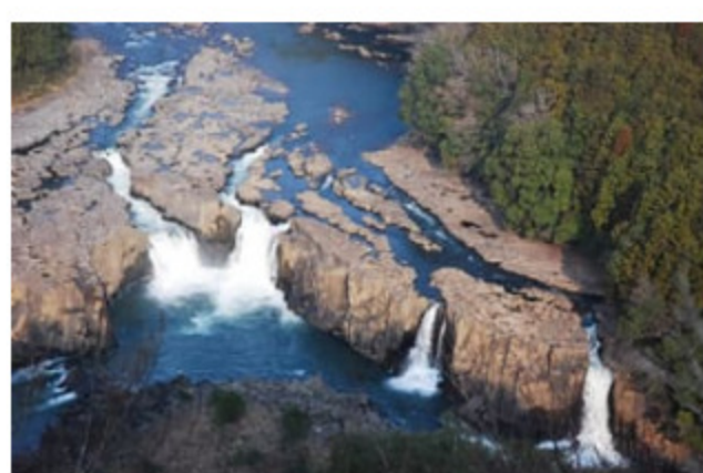
こもり たき 蛸の滝 *展望台

日本一と二位の石橋の競演 轟橋は昭和9年に架けられた2連のアーチ式石橋で、広いほうの径間（アーチの幅）が32.1mと日本一を誇ります。出会橋は大正13年に架けられ、径間が29.3mと日本第二位です。