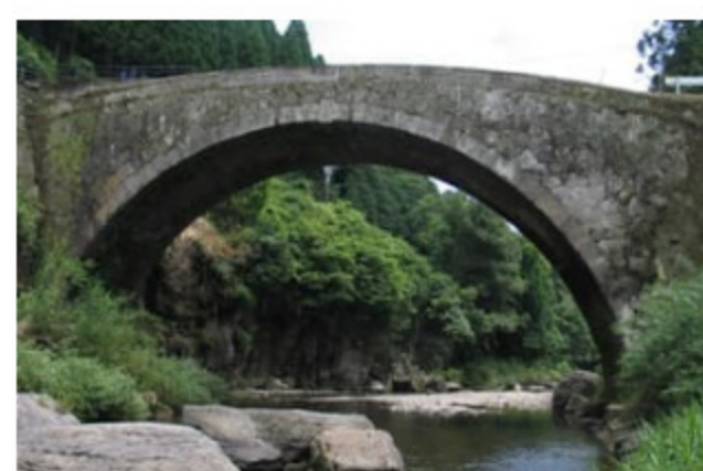
こうかんきょう 虹濁橋

*時間は駐車場（または駐車スペース）間の一般的な所要時間です。見学時間等は含まれていません。