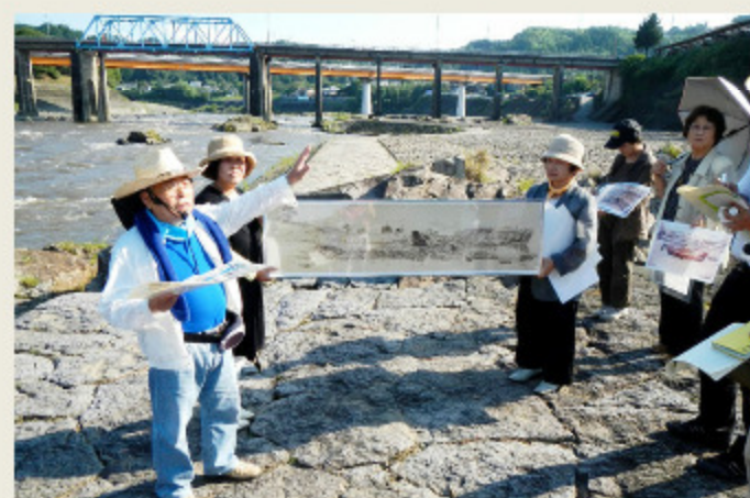
(写真は新規認定審査時および再認定審査時の現地審査風景)