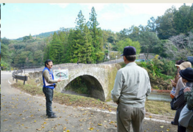
（写真は新規認定審査時および2017年再認定審査時の現地調査風景）