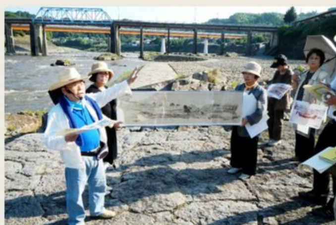
(写真は新規認定審査時および2017年再認定審査時の現地調査風景)