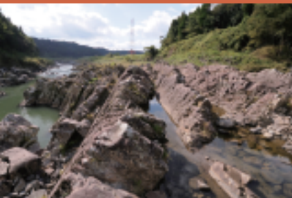
手取蟹戸(てどりがんど) およそ1億年前の地層

豊後大野市の歴史や風土、風景を 楽しむ「菅尾磨崖仏」「江内戸の景」 約5kmのウォーキングイベントです。 初心者の方も一人参加も大歓迎。 専門のガイドさんが観光スポットや 隠れた名所をご案内!豊後大野の 魅力を再発見しませんか!