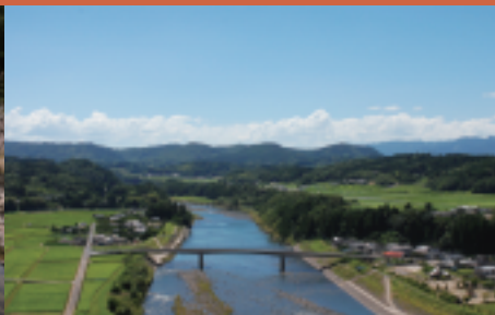
江内戸の景 大野川がもたらした豊かな大地

FAX又は、みえスポーツクラブ(フレッシュランド恵藤建設内)までお申し込みください